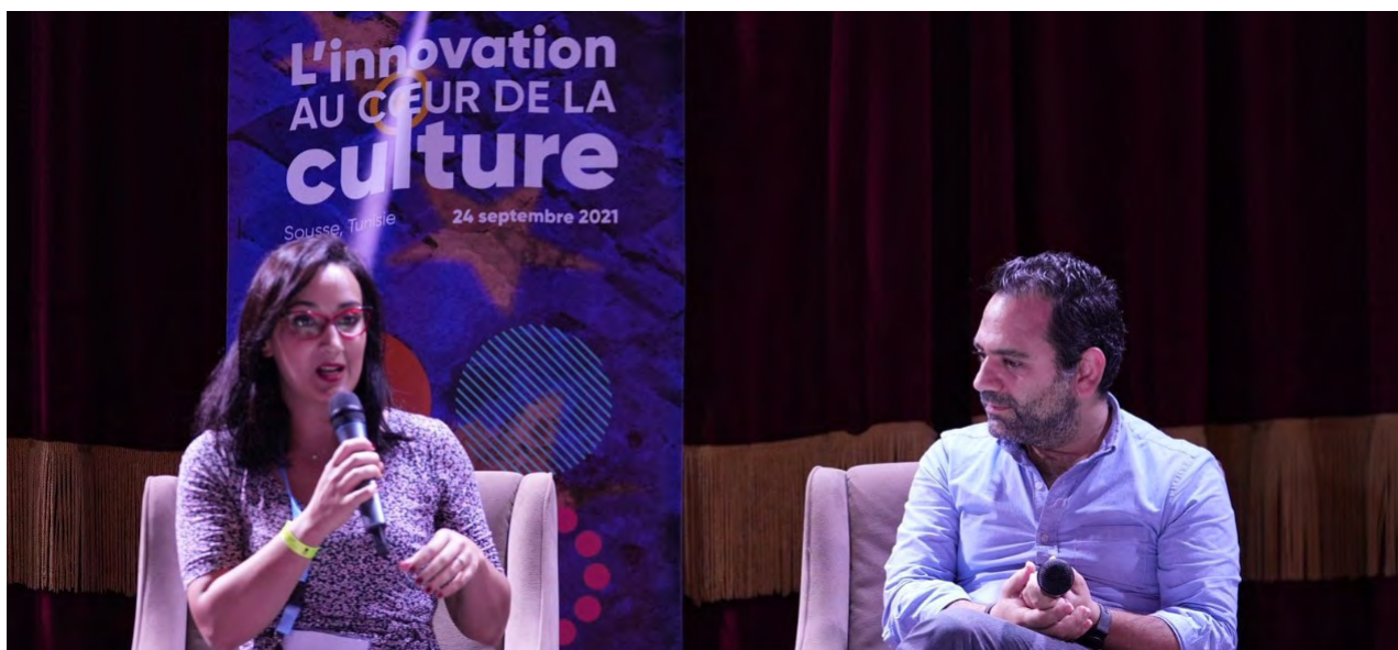
Table ronde « L'innovation au cœur de la culture »

Le 24 septembre à Sousse, en Tunisie, le projet EU Neighbours South a organisé une table ronde intitulée « L'innovation au cœur de la culture ». Cinq programmes et projets financés par l'UE et actifs dans le monde de la culture ont participé à cet événement pour présenter leurs activités et discuter des innovations dans le domaine de la culture et de l'impact du secteur sur les communautés cibles.