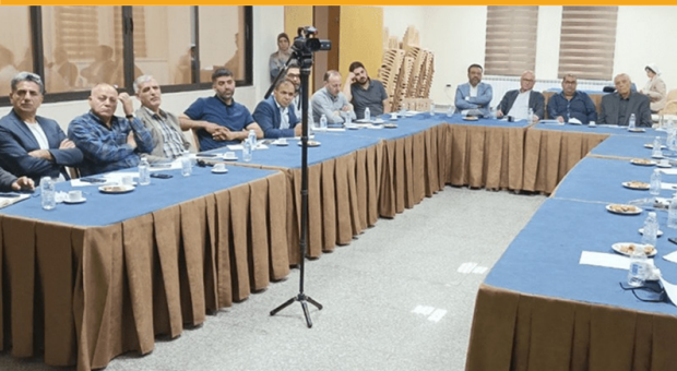
لبنان: التصدي للتحديات البيئية