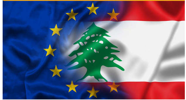
لبنان: الاتحاد الأوروبي يدعم الاستقرار والاقتصاد